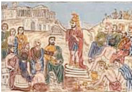
«Ο Περικλής από της Πνυκός δικαιολογών χάριν της Ακροπόλεως δαπάνας», έργο του λαϊκού ζωγράφου Θεόφιλου Χατζημιχαήλ

— Γοργίας: Την ικανότητα να μεταχειρίζονται λέξεις για να πείσουν τους ενόρκους δικαστές σε ένα δικαστήριο ενόρκων και τους βουλευτές στη βουλή και τους συγκεντρωμένους στη συνέλευση του λαού και σε κάθε άλλη συγκέντρωση πολιτικής φύσης.