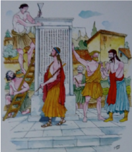
Σκίτσο του Στάθη: Κλήρωση

4. «Η μεταρρύθμιση του Κλεισθένη το 508/7 π.Χ. καθιέρωσε την αρχή της ευρείας συμμετοχής των πολιτών στη διακυβέρνηση του κράτους. Μετά από τον περιορισμό των αρμοδιοτήτων του Αρείου Πάγου το 462/1 π.Χ. από τον Εφιάλτη, η Αθήνα κατέστη ενσυνείδητα δημοκρατική και έγινε αντιληπτό ότι, προκειμένου αυτοί να μετέχουν ενεργά, θα έπρεπε να παρέχεται στους φτωχούς πολίτες χρηματική αποζημίωση για το χρόνο που αφιέρωναν στις υποθέσεις του κράτους. Έτσι, μεταξύ της δεκαετίας του 450 π.Χ. (για τους ενόρκους) και της δεκαετίας του 390 π.Χ. (για τη συμμετοχή στην Εκκλησία του Δήμου) εγκαινιάστηκε χρηματική αποζημίωση για πολλές πολιτικές υποχρεώσεις, τις οποίες το κράτος προέτρεπε τους πολίτες του να επιτελέσουν»