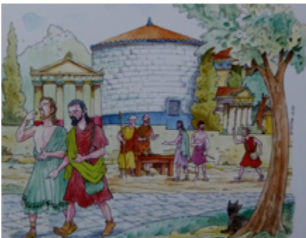
Σκίτσο του Στάθη: Μισθοφορά

7. «Οι μισθοί που δίνονταν στους άρχοντες, στους βουλευτές, στους ηλιαστές και στους εκκλησιάζοντες πολίτες δεν είχαν το νόημα αμοιβής για παρεχόμενες υπηρεσίες, αλλά απέβλεπαν στην αντιστάθμιση της ζημίας των πολιτών που έχαναν ένα μεροκάματο προκειμένου να ασκήσουν τα δημοκρατικά τους δικαιώματα. Ήταν μέτρο για να αποφευχθεί ο αυτοαποκλεισμός των φτωχών πολιτών από την κατάληψη δημοσίων λειτουργημάτων και από τη συμμετοχή τους σε συνεδριάσεις του Δήμου και των ηλιαστικών δικαστηρίων. [...] Οι μισθοί ήταν ίσοι ή κατώτεροι από το ημερομίσθιο ανειδίκευτου εργάτη»