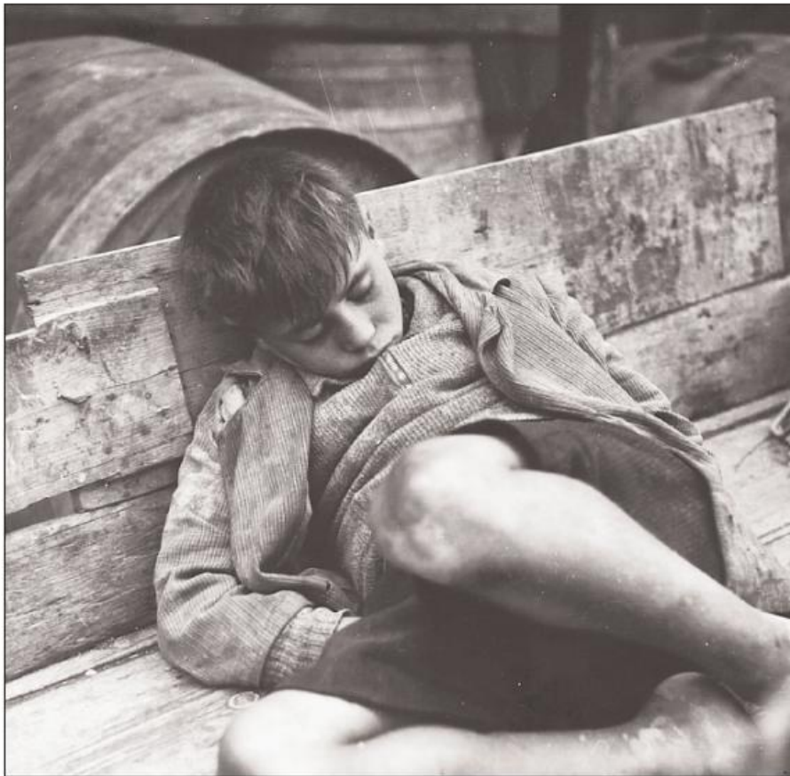
Παιδί αποκαμωμένο σε δρόμο της Αθήνας. 1941-1944.

Συνέχεια από την 9η σελίδα είχε το ατύχημα να έχει τρεις διαφόρους κατακτητές: τον Γερμανό, τον Ιταλό και τον Βούλγαρο...»